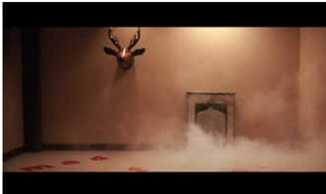
Sleeping over plastic Instalazioa / Instalación