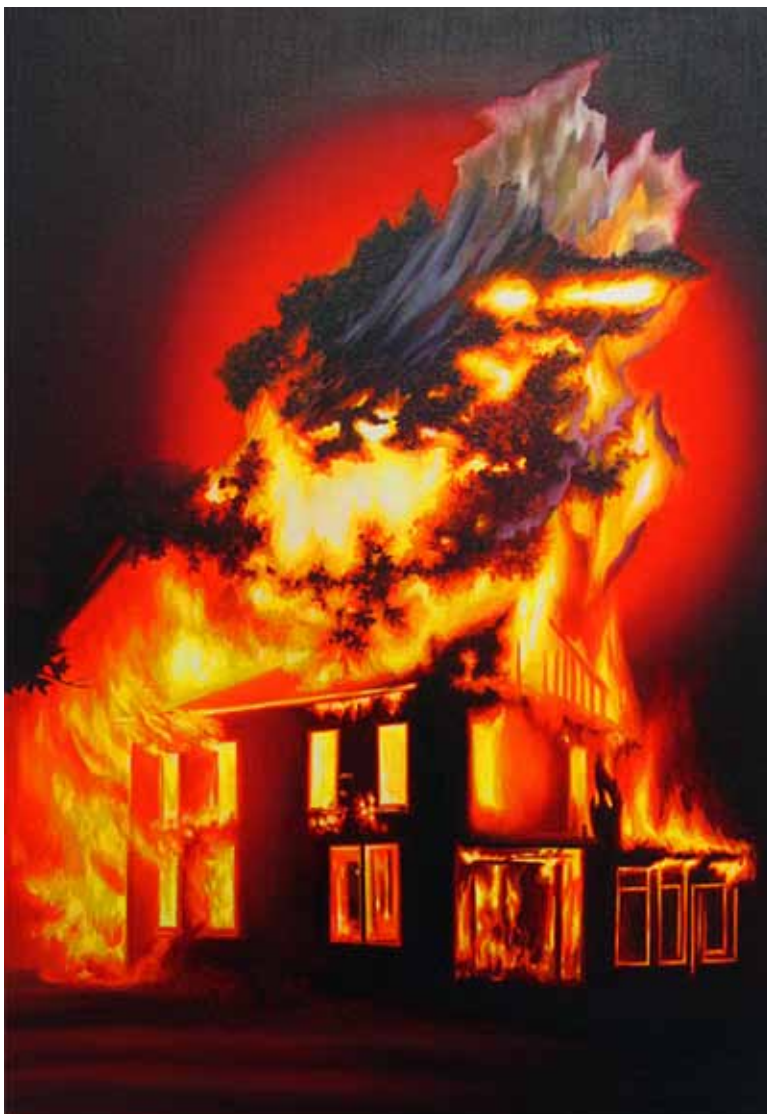
After Ólio-pintura mihisean / Óleo sobre lienzo 33 x 48 cm