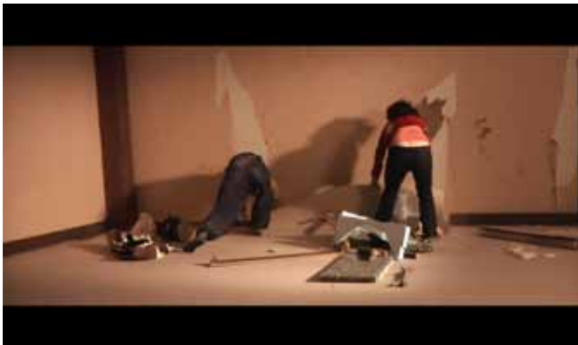
Sleeping over plastic Instalazioa / Instalación