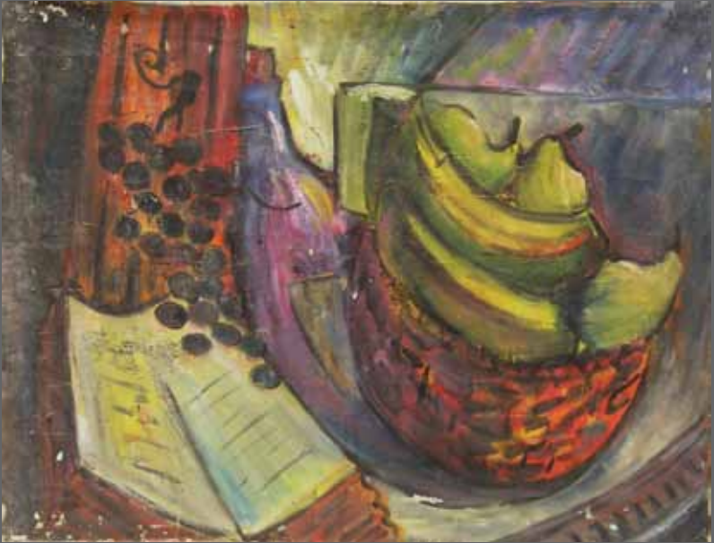
Bodegón. Óleo sobre lienzo, 50x65 cm (año 1974)

IKASKETA. Eragina. Mirespena. Ikasi. AHALEGINA APRENDIZAJE. Influencia. Admiración. Estudiar. ESFUERZO