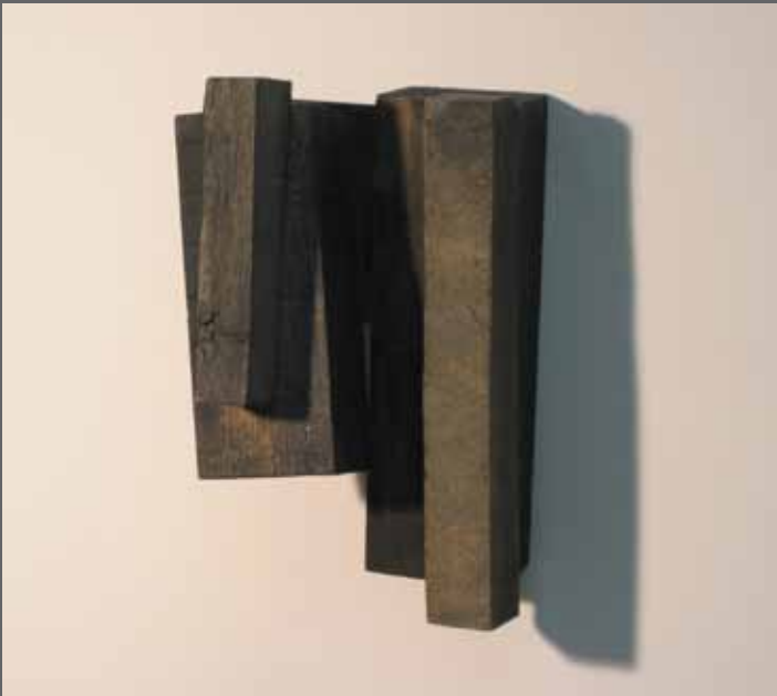
Pieza de Vía Crucis. Acrílico sobre maderas, 20x14x9 cm (año 2011)

ANTSIETATEA. Bakardadea. Sufrimendua. Ezintasuna. PORROTA ANSIEDAD. Soledad. Sufrimiento. Impotencia. DERROTA