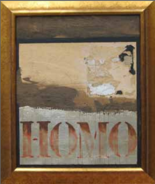
HOMO. Mixta sobre madera, 53x45 cm (año 1993)

HANDIKERIA. Harropuzkeria. Handinahikeria. Tentazioa. TRANPA VANIDAD. Petulancia. Engreimiento. Tentación. TRAMPA