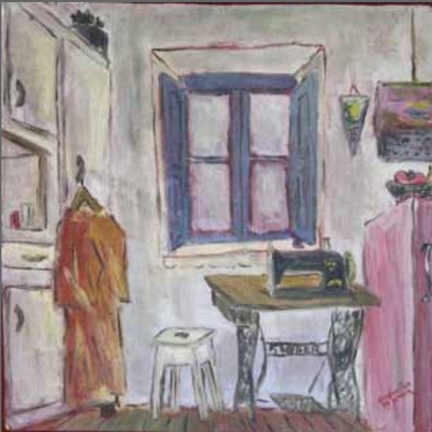
La máquina de coser. Óleo sobre tabla, 49x49 cm (año 1973)

ABSENTZIA. Nostalgia. Azterna. Bakardadea. GOZOTASUNA AUSENCIA. Nostalgia. Huella. Soledad. TERNURA