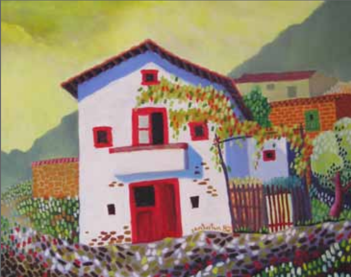
Caserío de El Regato. Óleo sobre lienzo, 34x42 cm (año 1982)

DESKUBRIMENDUA. Aukera. Idealizatzea. Errebelazioa. INTUIZIOA DESCUBRIMIENTO. Ocasión. Idealizar. Revelación. INTUICIÓN