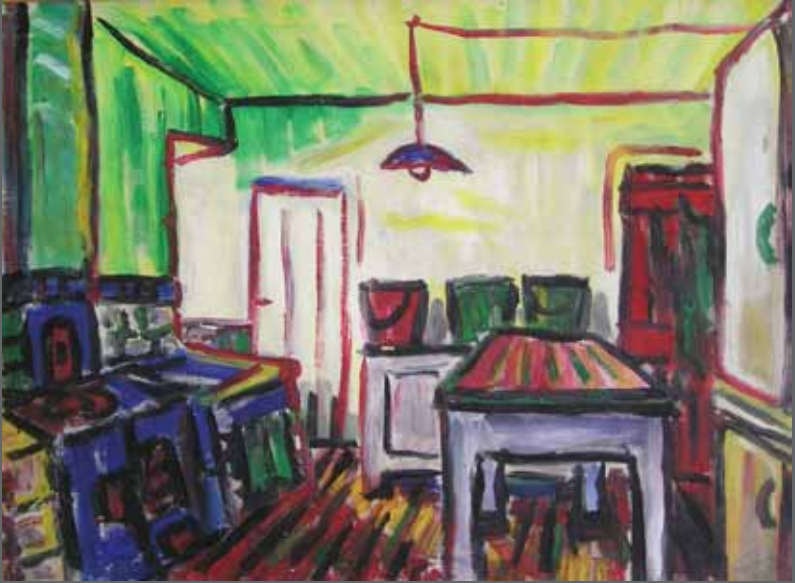
La cocina. Óleo sobre lienzo, 60x81 cm (año 1975)

ILUSIOA. Gogo bizia. Askatasuna. Sutea. GOZAMENA ILUSIÓN. Entusiasmo. Libertad. Incendio. GOZO