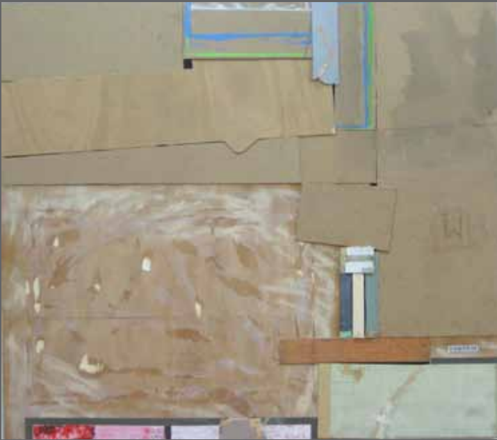
Maitea adquirido. Mixta sobre maderas, 160x180 cm (año 2009)

GUPIDA. Ezegonkortasuna. Erredentzioa. Mina. MATERIA COMPASIÓN. Precariedad. Redención. Dolor. MATERIA