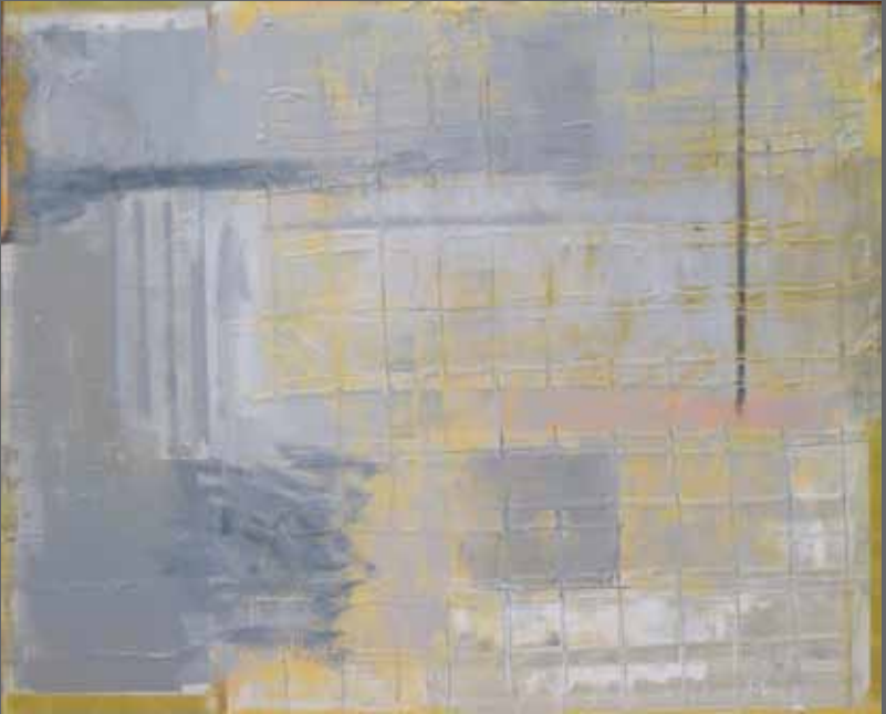
Pared gris y amarilla. Mixta sobre madera, 99x122 cm (año 2009)

BILATU. Sumatu. Sentsazioa. Arrastoa. ITXARON BUSCAR. Intuir. Sensación. Rastro. ESPERAR