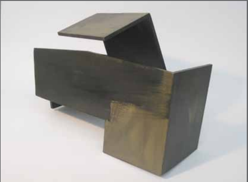
Abrazo vencido. Acero lacado, 45x32x21 cm (año 2010)

ASMATU. Inspirazioa. Amets egin. Zintzotasuna. AUSARDIA INVENTAR. Inspiración. Soñar. Sinceridad. ATREVIMIENTO