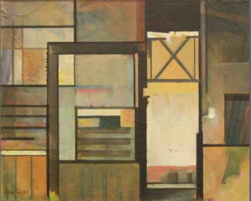
Interior de fábrica. Mixta sobre madera, 34x42 cm (año 2000)

ERAIKI. Ordena. Oreka. Proportzioa. HARMONIA CONSTRUIR. Orden. Equilibrio. Proporción. ARMONÍA