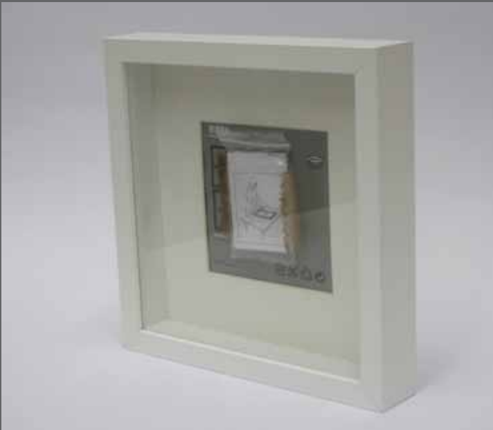
IKEA WHITE. Técnica mixta, 25x25 cm (año 2010)

EZEREZA. Itxura. Erraztasuna. Dekorazioa. IRUZURRA NADA. Apariencia. Facilidad. Decoración. ENGAÑO