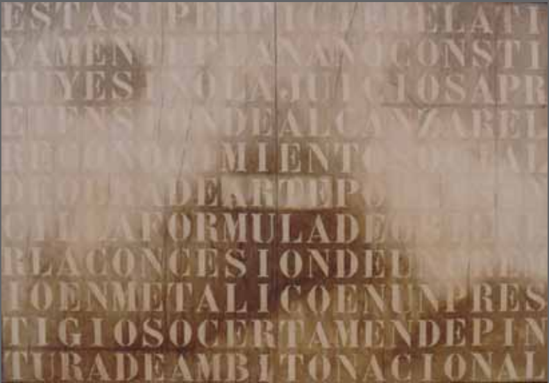
Esta superficie... Mixta sobre madera, 140x200 cm (año 1992)

PENTSATU. Aurkikuntza. Ideia. Burutapena. Hausnarketa. ARGIA PENSAR. Hallazgo. Idea. Ocurrencia. Reflexión. LUZ