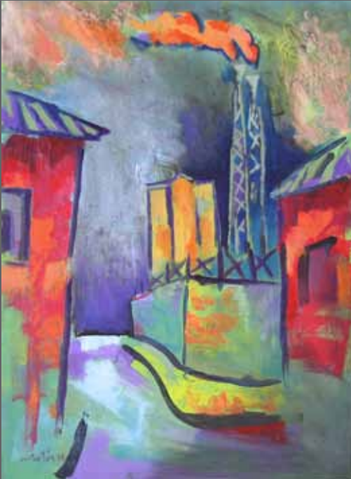
Lutzana. Mixta sobre madera, 90x65 cm (año 1994)

ENERGIA. Basakeria. Obsesioa. Zoramena. BIHOTZA ENERGÍA. Fiereza. Obsesión. Locura. CORAZÓN